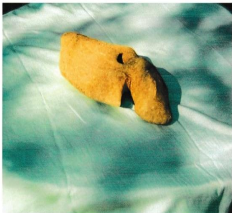
Unelte din Paleolitic și Neolitic de pe teritoriul comunei Vilcele,jud.Olt

interesant fragment de idol feminin ,de asemenea cu fragmente specifice aceleiași culturii Coțofeni:benzi incizate,umplute cu liniuțe paralele.